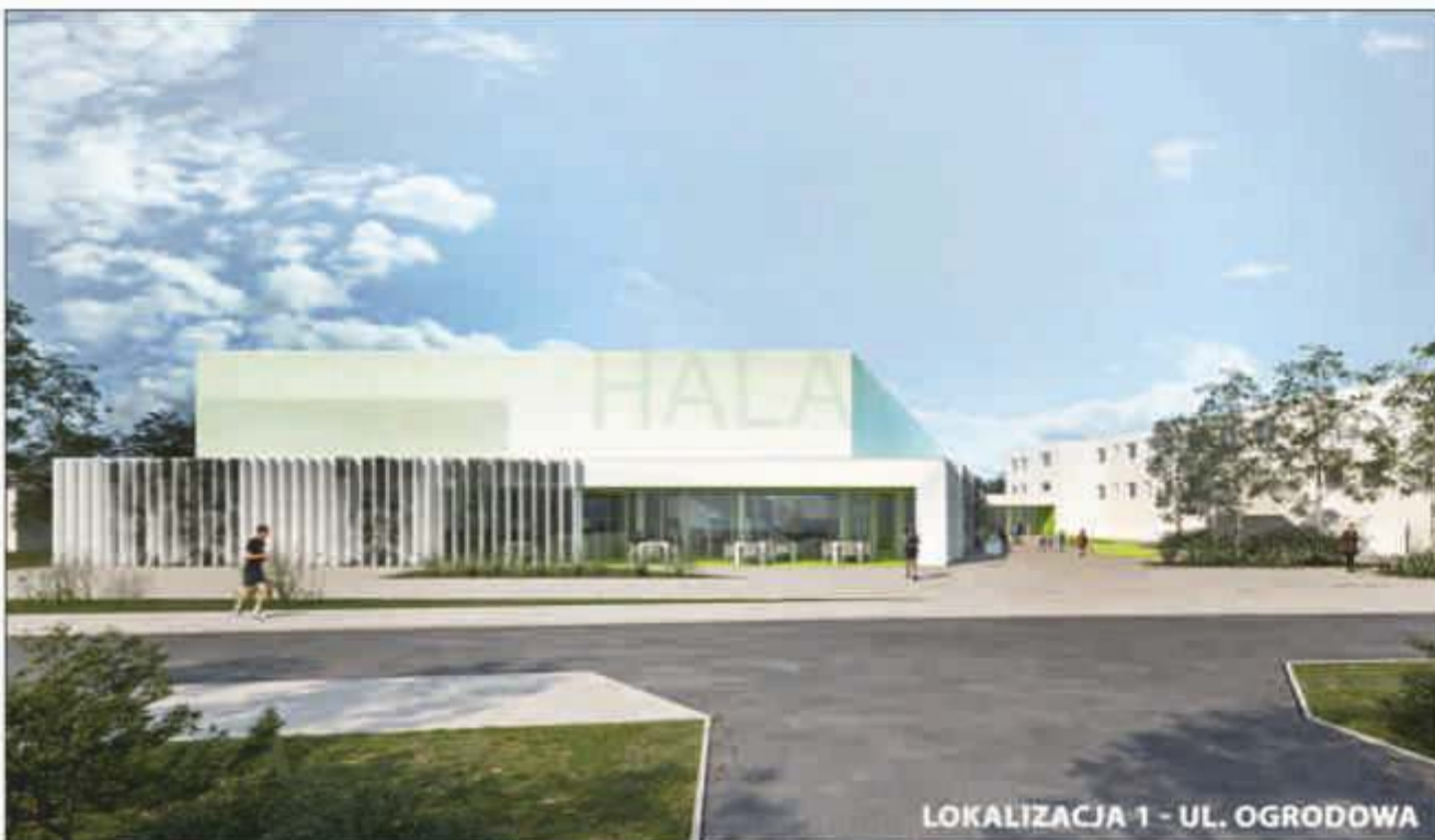
LOKALIZACJA 1 - UL. OGRODOWA

W postępowaniu przetargowym ofertę złożyło 11 firm. Choć ich otwarcia dokonano w połowie grudnia ubiegłego roku, to dopiero po ponad 2 miesiącach dokładnej analizy, wyłoniono wykonawcę, który w świetle przyjętych kryteriów, złożył najkorzystniejszą ofertę oraz spełnił wszystkie warunki określone w Specyfikacji Istotnych Warunków Zamówienia (SIWZ) a także w ustawie – Prawo zamówień publicznych. Przypomnijmy, że hala będzie miała charakter wielofunkcyjny. Jej budynek zaprojektowano jako obiekt dwukondygnacyjny o łącznej powierzchni użytkowej 2 388,99m, przy czym obok głównej sali sportowej znajdować się będą po dwa zespoły szatniowe na parterze i na piętrze. Dodatkowo w obiekcie zaplanowano pomieszczenia na lokal gastronomiczny (kawiarnię), salę zabaw dla dzieci wraz z salą na przyjęcia oraz część sportową z przeznaczeniem na siłownię i fitness. Hala będzie w pełni przystosowana dla osób niepełnosprawnych. Ciekawym rozwiązaniem, jaki zaproponowali jej architekci, jest połączenie hali sportowej wspólnym dziedzińcem z istniejącym przedszkolem, co w efekcie stworzy kolejne miejsce relaksu dla mieszkańców. Przypomnijmy, że nowy obiekt sportowy powstanie w Książu Wlkp. przy ul. Ogrodowej w sąsiedztwie miejscowego przedszkola „Bajkowy Świat”. Warto w tym miejscu dodać, że w lutym